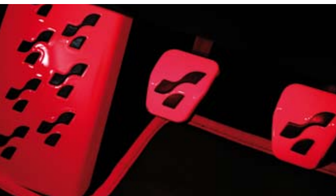
Rotlichtmilieu: Die Pedalerie mit Golf-R-Design wurde weiß lackiert und wird mit Rotlicht angestrahlt.

Electro-Beats macht die Anlage richtig Laune und verwöhnt den Hörer mit einer sanften bis mäßigen Tieftonwelle, die bei den Subwoofern im Heck ihren Anfang nimmt und mit den vier Kickbässen im Cockpit an die Ohren des Fahrers brandet.