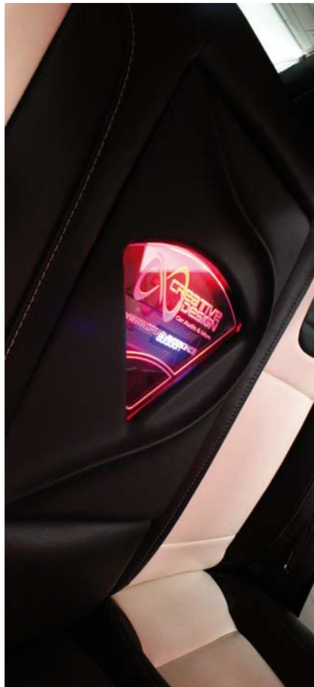
Alles andere als Standard: An Details wie diesen wird deutlich, mit wie viel Liebe die Einbauer von Creative Design gearbeitet haben.

geschickt in den Sideboards der Flügeltüren untergebracht wurden. „Die Kickbässe haben wir mit einer sehr starken Dämmung in den Doorboards verankert, weil die Vibrationen doch sehr stark werden können“, erklärt Sascha die Maßnahme. Verständlich, denn die Verkleidung muss Frequenzen zwischen 50 bis 300 Hz standhalten, und das bei einem Pegel von 18 dB. Bei einem Standard-Golf würden die Türen bei dieser Belastung vermutlich auch ohne Tuning Flügel bekommen. Die iPaul 2.400 wird von dem Vierkanal-Leistungsverstärker Rainbow BPM 245.000 mit zusätzlicher Power versorgt. Womit wir auch schon beim Herzstück der Anlage angekommen wären, dem Alpine-Moniceiver IVA-W502 R. Der Moniceiver wurde zur Klangabstimmung mit dem Soundprozessor Audison bit one verbunden. Dieses praktische Helferlein teilt den beiden iPaul-Verstärkern die Frequenzen für die vollaktiven Lautsprecher zu und stellt den Equalizer entsprechend ein. Der Soundprozessor thront zusammen mit einer iPhone-Halterung auf der schick umgebauten Mittelkonsole. Ebenfalls an Bord befindet sich das Bluetooth-Modul Alpine KCE-400 BT. Damit lässt sich sowohl die Musik via A2DP auf die Anlage streamen als auch per Bluetooth telefonieren.