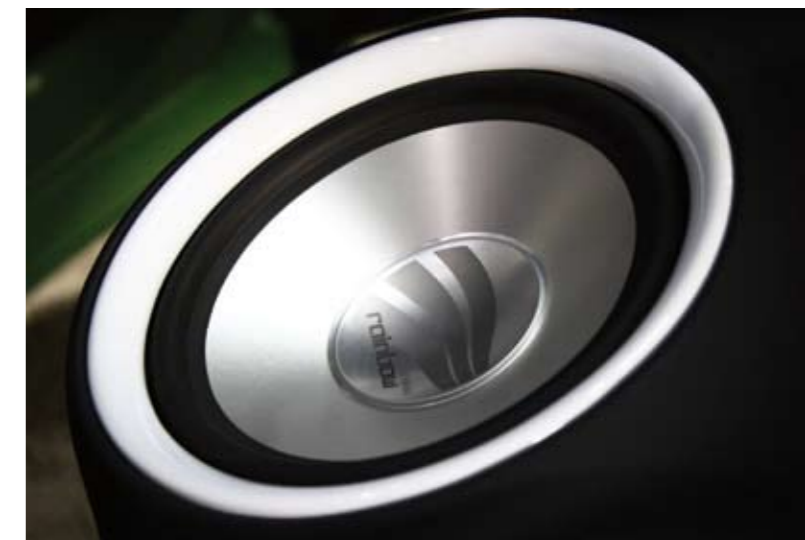
Durchgestylt: Von der Druckanzeige für das Luftfahrwerk bis hin zum versenkten und beleuchteten Lautsprecher stimmt hier einfach alles. Ein Hingucker ist auch die umgebaute Mittelarmlehne mit iPhone-Halterung und dem Soundprozessor Audison bit one.

Für Unterhaltung auf den hinteren Plätzen sorgen die zwei Alpine Monitore TME-S370, die in den Sitzschalen verbaut wurden. Ein anspruchsvolles Unterfangen, wie uns Sascha erzählt, denn die Sitzschalen fallen längst nicht so dick wie herkömmliche Autositze. Hier war erneut das Know-how seitens des Einbauteams gefragt. Einerseits sind die HiFi-Komponenten unverzichtbar für guten Klang, andererseits klingt auch die beste Anlage ohne hochwertige Kabel nur halb so gut, wie sie könnte. In Saschas Golf wurden ausschließlich Kabel von AIV verlegt, unter anderem Cinch- und Videokabel aus der Arctic-Serie. Für die ausdauernde Stromversorgung der mächtigen Aktivanlage zeichnet die Batterie Stinger SPP 2150 verantwortlich.